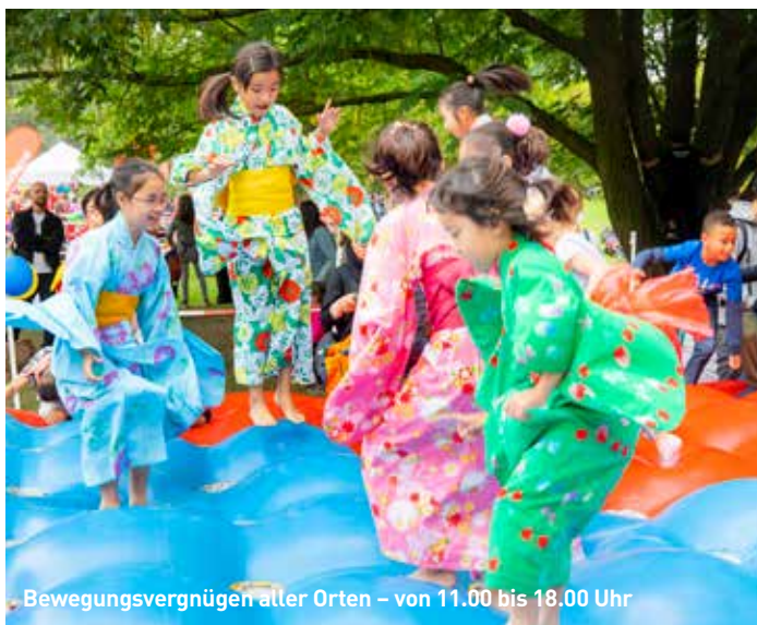
Bewegungsvergnügen aller Orten – von 11.00 bis 18.00 Uhr

Alle Angebote sind kostenlos und auch im Museum für Hamburgische Geschichte ist der Eintritt am 17. September frei.