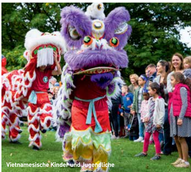
Vietnamesische Kinder und Jugendliche