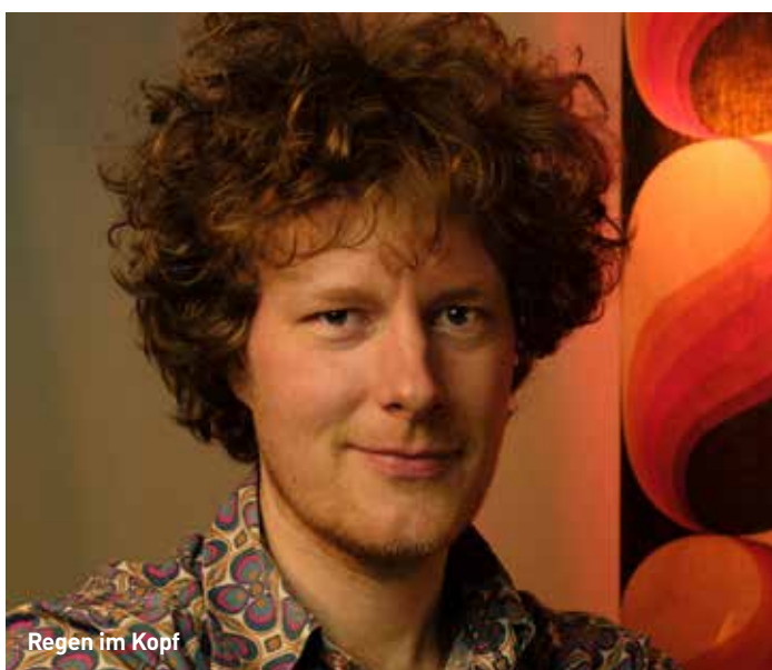
Regen im Kopf