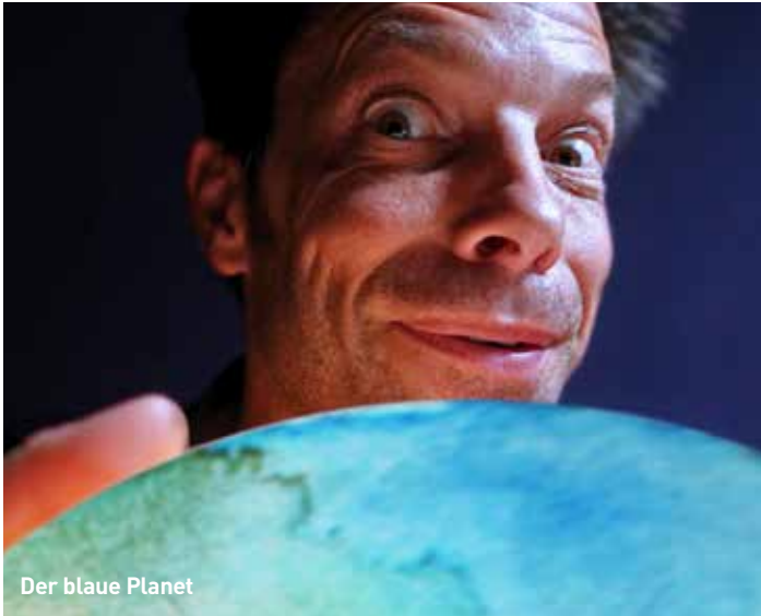
Der blaue Planet