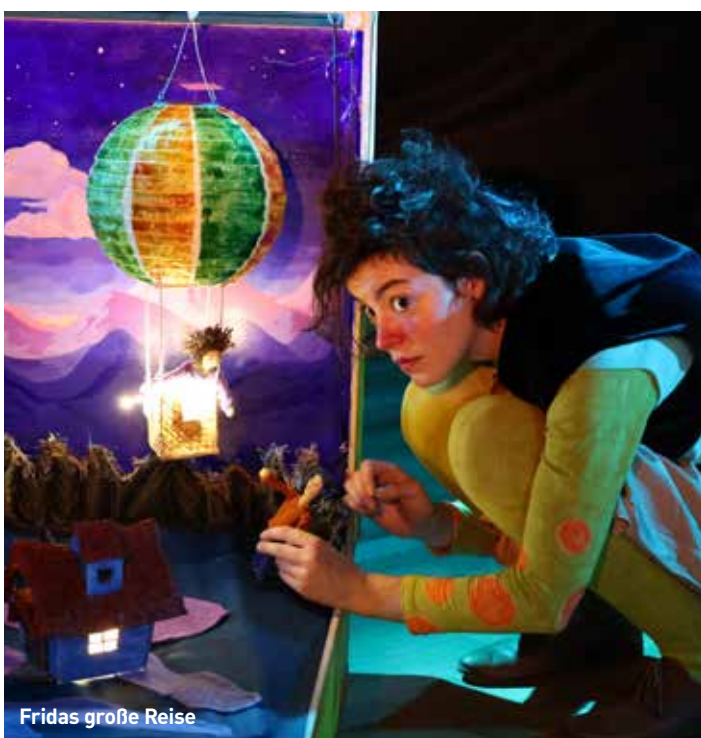
Fridas große Reise