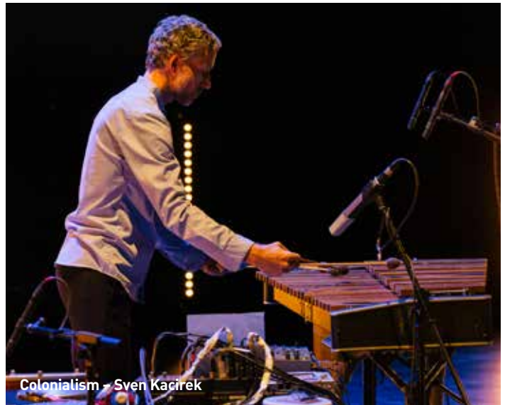
Colonialism – Sven Kacirek