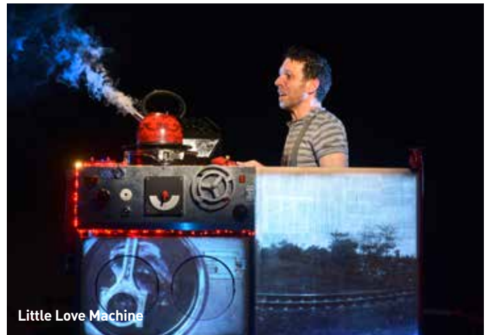
Little Love Machine

Animation: Hadar Lansberg. Ohne Worte – 40 Minuten