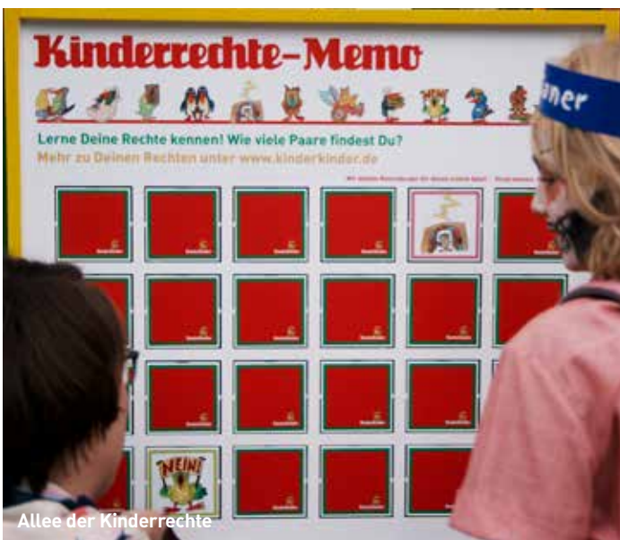
Allee der Kinderrechte