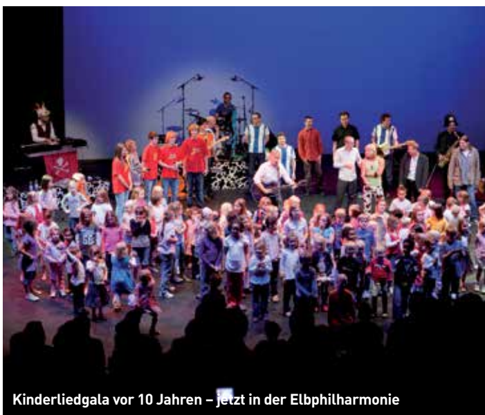
Kinderliedgala vor 10 Jahren – jetzt in der Elbphilharmonie