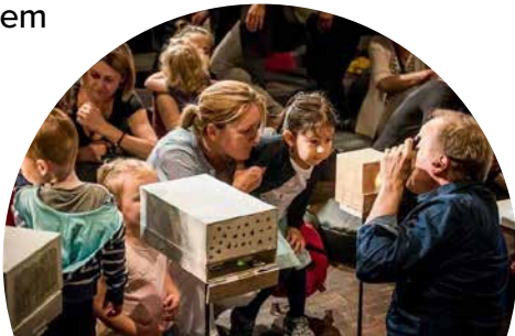
Zuhause / Billions of Bugs

Das Finale des Festivals wird in diesem Jahr in der FABRIK gefeiert.